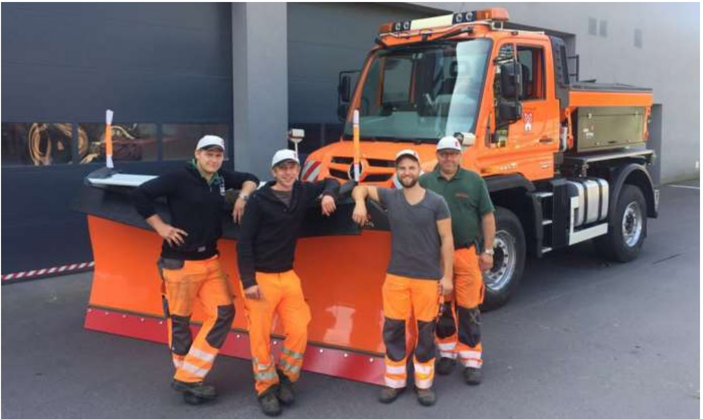
Anfang September wurde der Vorführ-Unimog von der Fa. Papas an die Bauhofmitarbeiter übergeben.