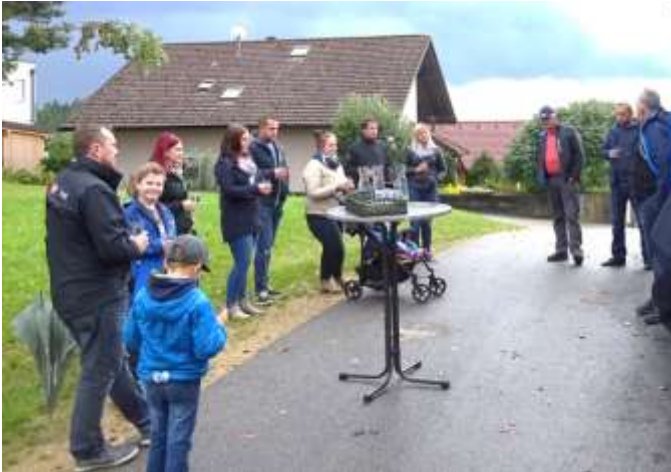
Die neuen Mitglieder zeigten besonderes Interesse am Tag der Offenen Tür.

Die Mitgliederanzahl der Wassergenossenschaft Erdleiten konnte in den letzten 2 Jahren um mehr als 50 % aufgestockt werden. Derzeit versorgen wir 31 Mitglieder mit hervorragendem Trinkwasser. Es wurden große Investitionen in Angriff genommen und im Zuge der Kanalisierung miterledigt. Damit ist unser Versorgungsnetz auf dem neuesten Stand und es konnten 10 neue Baugründe mitergeschlossen werden. Großer Dank gilt den Gemeindevorantwortlichen, den Genossenschaftsmitgliedern, die diese notwendigen Schritte erkannt und auch durchgesetzt haben.