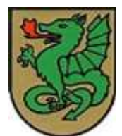
St. Georgen am Walde

anschl. Frühschoppen am Marktplatz mit der Musikkapelle Bad Zell