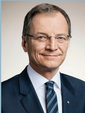
Mag. Thomas Stelzer