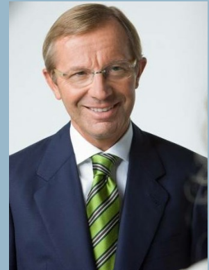
Dr. Wilfried Haslauer