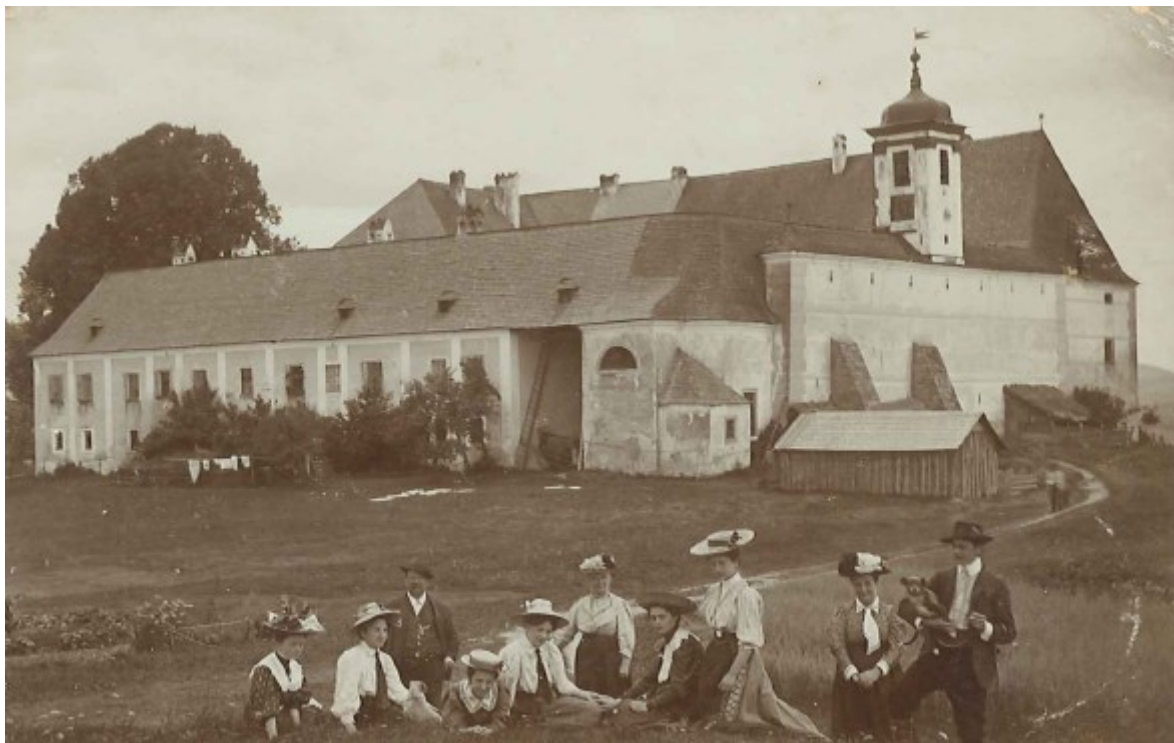
Stilleben auf Schloss Zellhof anno 1895